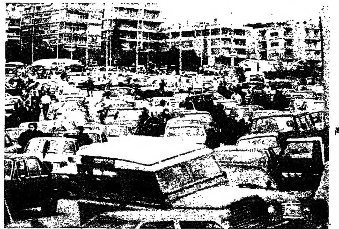
السيارات تظل الطرق في الحزامية نهار اسس